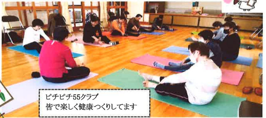
ピチピチ55クラブ 皆で楽しく健康づくりしてます