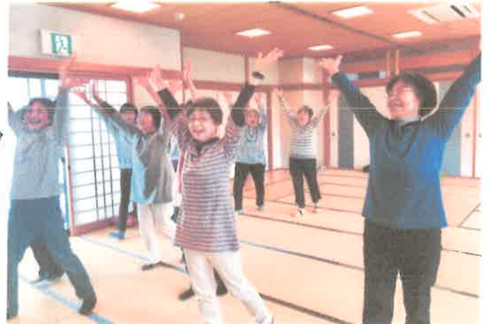
健康体操教室(ポ-チュラカとベ)のみなさん。 新しい方も来られ、13名の参加でした。 どなたでもご参加できますよ。