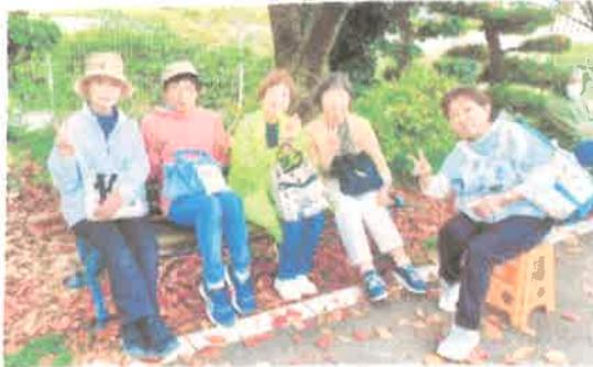
健康フェスタ。お疲れさまでした。