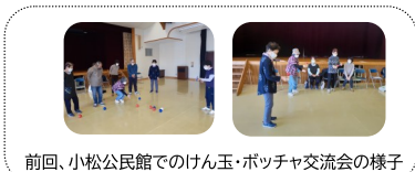
前回、小松公民館でのけん玉・ポッチャ交流会の様子