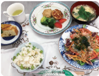
1食 総塩分量は2.7g (デザート含まず)