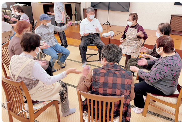
協立ブロック 南西支部フレッシュサロン

設立趣意を受け継いで 結核患者・生活困窮者の医療・生活相談、地域での健康講話や健康診断受診の促進、労災職業病や公害被害者支援などにも積極的に取り組んできました。老人医療費無料化など社会保障を充実させる運動にも取り組んできました。無差別平等の医療提供を実践し、創設以来、入院時の差額ベッド料をいまだ