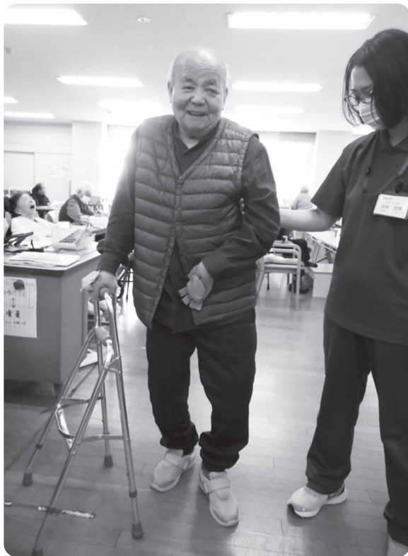
サイドケインを支えに歩くAさん

ずっと希望を持ち続け、努力を重ねました。自分の身体を自分でコントロールできるようになり、そして、遂にサイドケインを支えるようになりました。「歩ける!」Aさんは涙ぐ