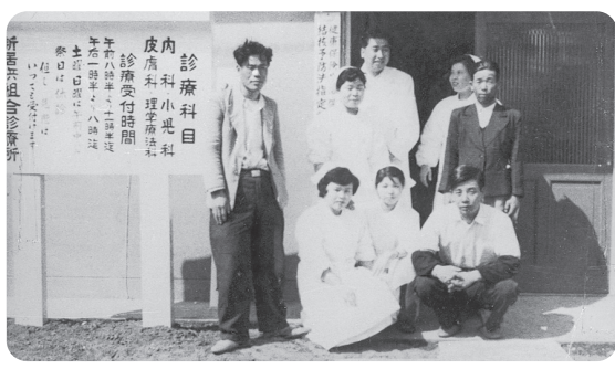
創立頃の平和診療所