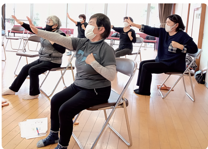
生協ブロック 小野支部フレイル講座

害者支援などにも積極的に取り組んできました。老人医療費無料化など社会保障を充実させる運動にも取り組んできました。無差別平等の医療提供を実践し、創設以来、入院時の差額ベッド料をいまだ