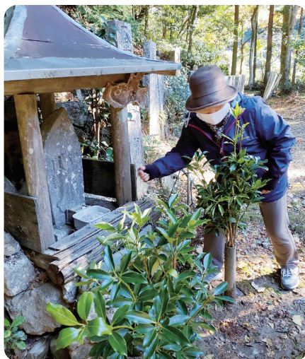
12番札所は小さな祠です

触れてのんびり過ごし、おしゃべりに花が咲くのも楽しみの一つで、笑い声が堪えません。ウォーキングなので雨が降れば活動中止なのですが、今のところ毎回とても良い天気です、きっといろいろな目に見えない力が応援してくれているのかなと思っています。