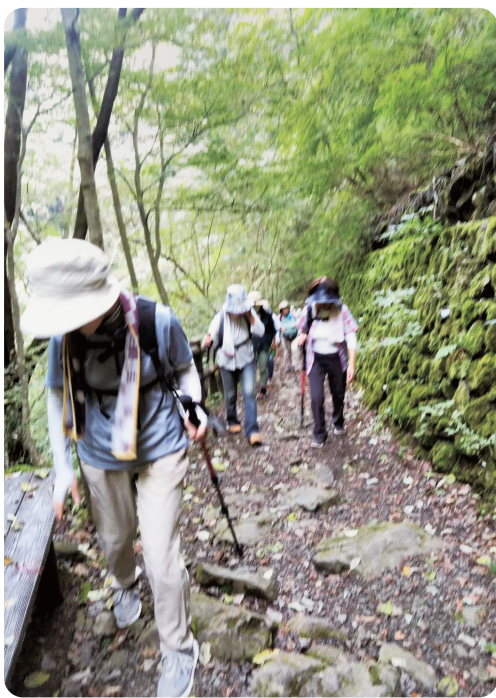
山道を登ります(白猪の滝)

そんな時、川内地区には西国33佛参りという札所が設置されていた事を思い出しました。早速メンバーに話してみると、札所の案内図も手に入り、全部巡れば川内地区を一周できそうです。「よし、33佛参りをしよう!」と決め、準備を進めていると、以前にお参り