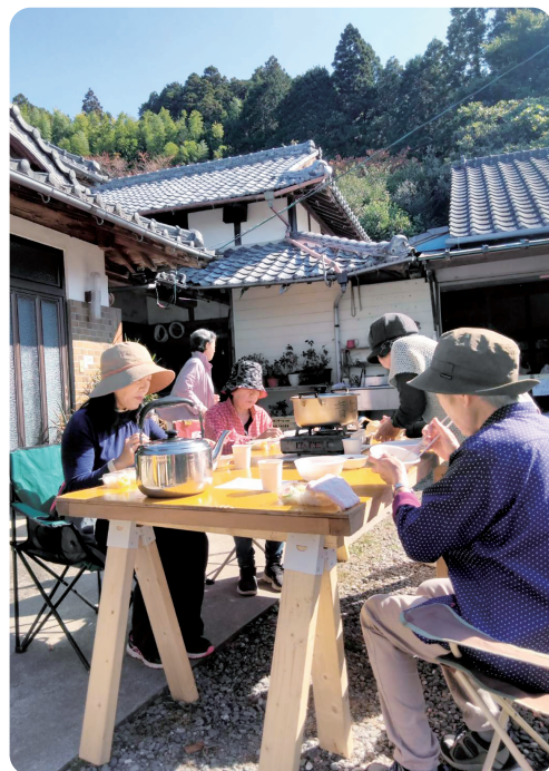
芋炊きを頂きました

秋の気配が感じられる10月初め、①番札所の白猪の滝とその近くの②③番札所をお参りしました。札所を探すのは、宝探しをするかのように意外と面白くて、大切な物を見つけ出したように嬉しく楽しかったです。一回目で既に札所巡りの魅力が十分に感じることがで